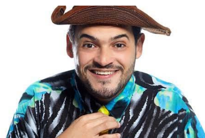
Stand-up comedy no Municipal de São Gonçalo