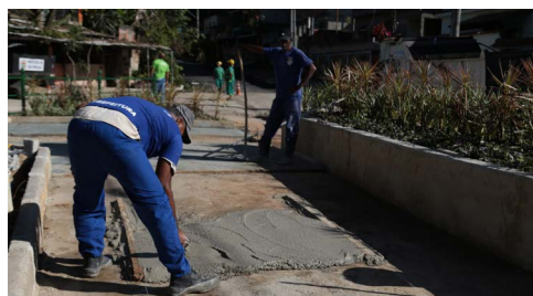
Ruas do Sacramento recebem reparos e revitalização de praça

LEIA AS MATÉRIAS NO SITE OFICIAL DA PREFEITURA