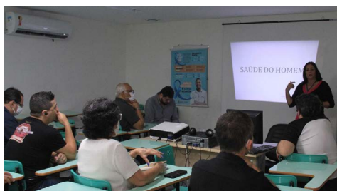
São Gonçalo investe na saúde do homem