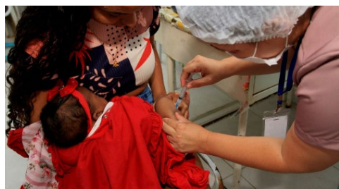
São Gonçalo inicia campanha contra polio e multivacinação

LEIA AS MATÉRIAS NO SITE OFICIAL DA PREFEITURA