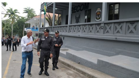
São Gonçalo ganha base da Recom